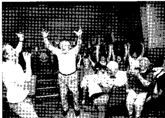
ingesandt von Frank Ratajzak

Wie schon in den vergangenen 9 Jahren wurde auch diesmal die Brandenburgische Seniorenwoche in der Gaststätte Raunigk in Gehren mit vielen Senioren der Gemeinde Heideblick gefeiert. Die Fröhlichkeit und ausgelassene Stimmung, die im Saal herrschten, lassen darauf schließen, dass es ein gelungener Nachmittag war. Und auch Musik und humorvolle Einlagen trafen den Geschmack der Gäste. Danken möchten wir auf diesem Wege allen Sponsoren - sie wurden bei der Veranstaltung auch namentlich genannt - sowie allen fleißigen Helfern, die zum Gelingen beigetragen haben.