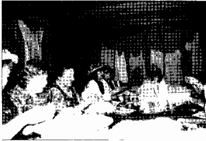
Hier werden bei Spaß und Geselligkeit die Federn der Martins- und Weihnachtsgänse von den fleißigen Frauen gerissen.

Und wieder geht's zum Höllberghof - im Kuhstall