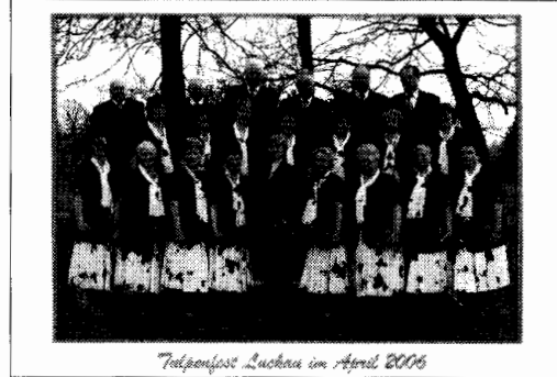
Tulpenfest Luckau im April 2006