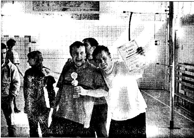
Die Freude der Sieger